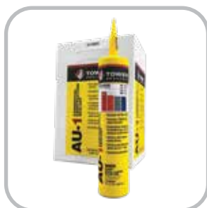
10.1 oz. Cartridge