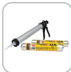
20 oz. Sausage