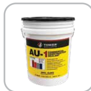
2 gal. Pail or 5 gal. Pail